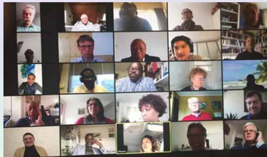
In gesprek met politieke partijen over de gevolgen van de coronacrisis voor de internationale kerken.

De aanpak was tweeledig. Ten eerste was er de informatievoorziening richting kerken over de overheidsmaatregelen. Dit was nodig, omdat reguliere informatievoorziening via de media niet was toegespitst op de situatie van kerken, en bovendien alleen Nederlandstalig, waardoor het niet automatisch alle internationale kerken bereikte. We hebben informatie vertaald, verspreid onder onze netwerken, en door middel van praktische video's en webinars toegankelijk gemaakt. De verschillende partners droegen hier ieder naar vermogen aan bij en wisselden zoveel mogelijk tips uit. SKIN organiseerde o.a. een